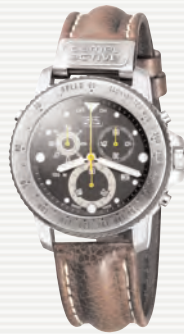
La montre outdoor originale pour homme depuis 1986